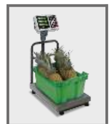
Puede usarse para despacho y recibo de mercancía