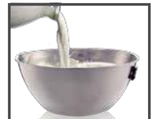
Tazón de acero inoxidable con graduación