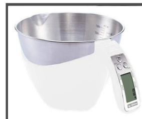
Tazón desmontable para facilitar su limpieza